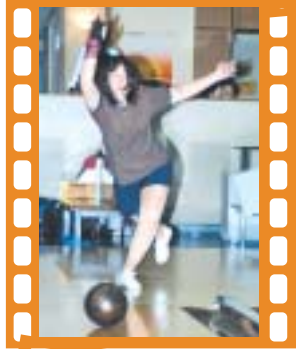
年齢別ボウリング 11月12日(日) 新三国アルゴ