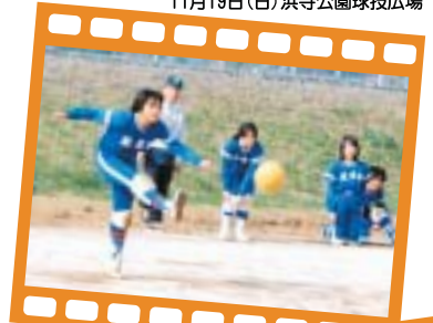
キックベースボール 11月19日(日)浜寺公園野球広場