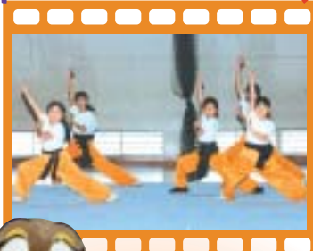
武術太極拳 11月19日(日)府立今宮高校