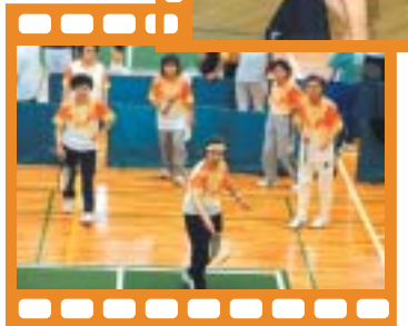
バウンドテニス 11月5日(日)阪南市立総合体育館