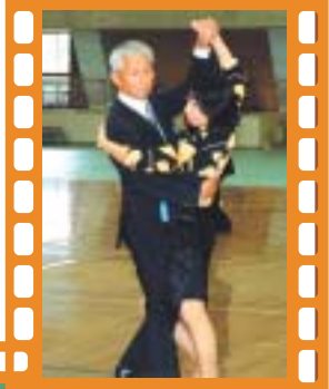
ボールルームダンス 10月22日(日) 吹田市立北千里市民体育館