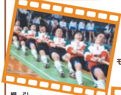
網引 11月26日(日)なみはやドーム