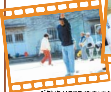
ベタンク 11月23日(祝)府立布施北高校