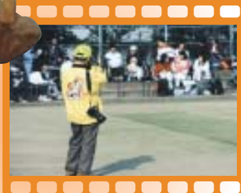
撮影するモッピークラブ会員