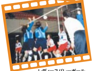
レディースバレーボール 12月1日(金)府立体育会館