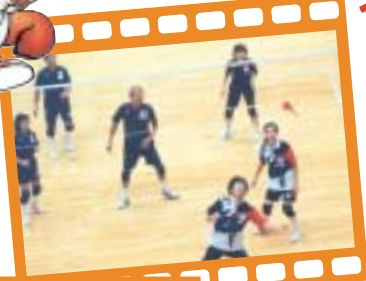
インディアカ 10月15日(日) なみはやドーム